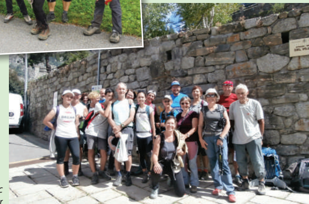
Treking Mont Blanc