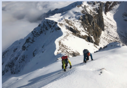
Pristop na Škofič