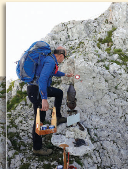
Delovna akcija Krn in Batognica 2020

GOSPODARSKI ODSEK skrbi za upravljanje, oskrbo in vzdrževanje petih planinskih koč, ki so v lasti društva. Stalna skrb za vzdrževanje objektov nalaga maloštevilnim članom še toliko večjo angažiranost. Vsi, ki bi radi sodelovali pri akcijah, lepo vabljeni.