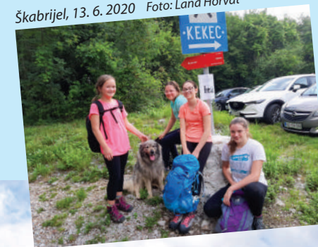
Škabrijel, 13. 6. 2020