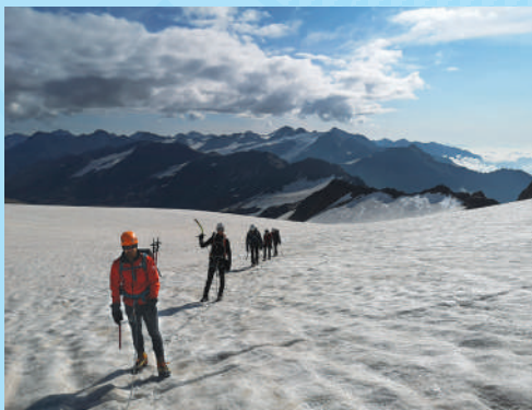
Ledenik pod Weisskuglom