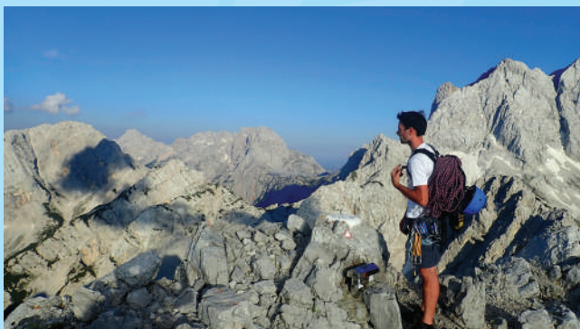
Na vrhu Velike Babe