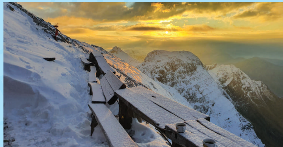
Pogled iz Krna