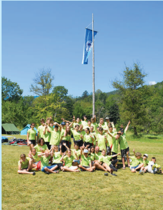
45. mladinski planinski tabor Nadiža