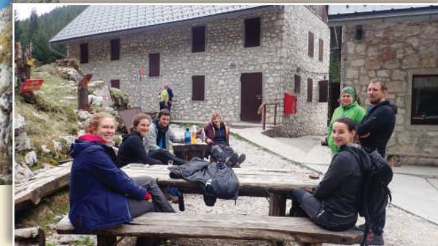
Delovna akcija Krnska jezera maj 2020