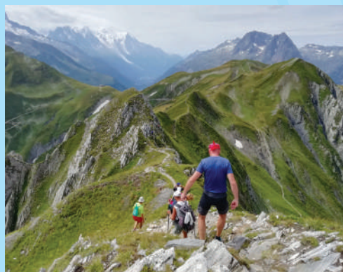
Sestop s CROIX DE FER proti izhodišču COL DE BALME (2191m) - trekking Mont Blanc