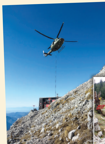
Prevoz materiala na Krn 24. 11. 2020