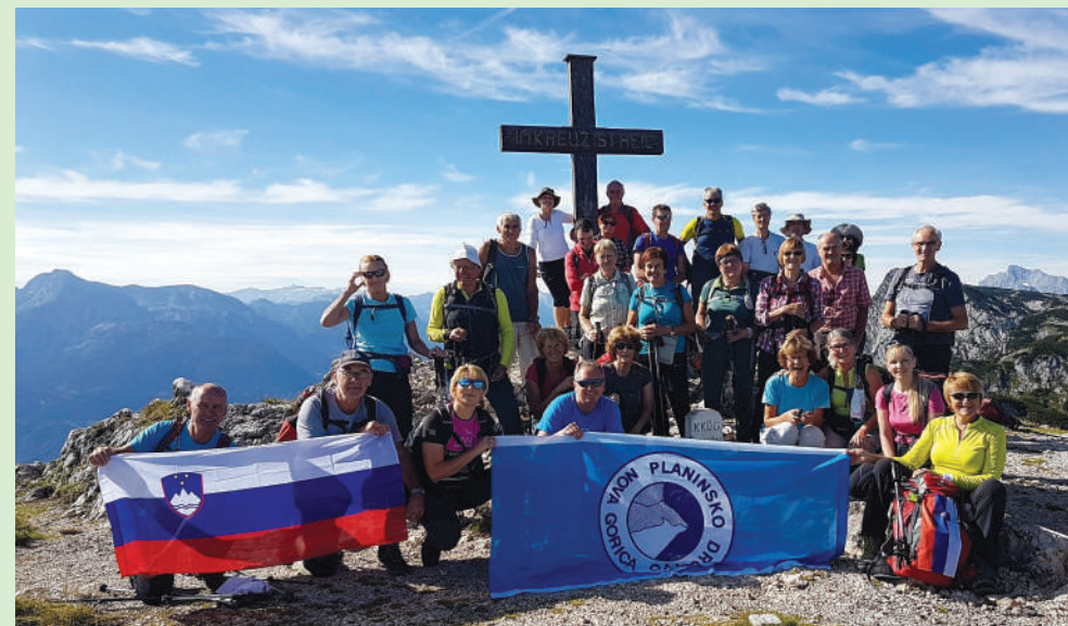
Pogorje Untersberg Nemčija