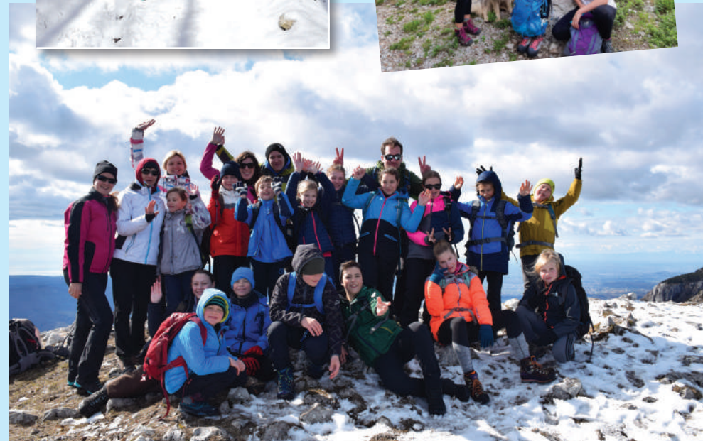
Kucelj, 7. 3. 2020