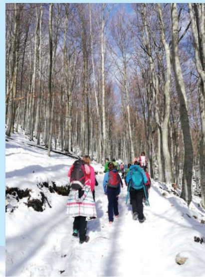
Proti Kuclju, 7. 3. 2020

Sončne pozdrave vam pošiljamo člani mladinskega odseka.