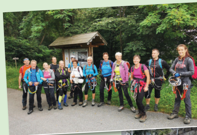
Ferrata Vajont