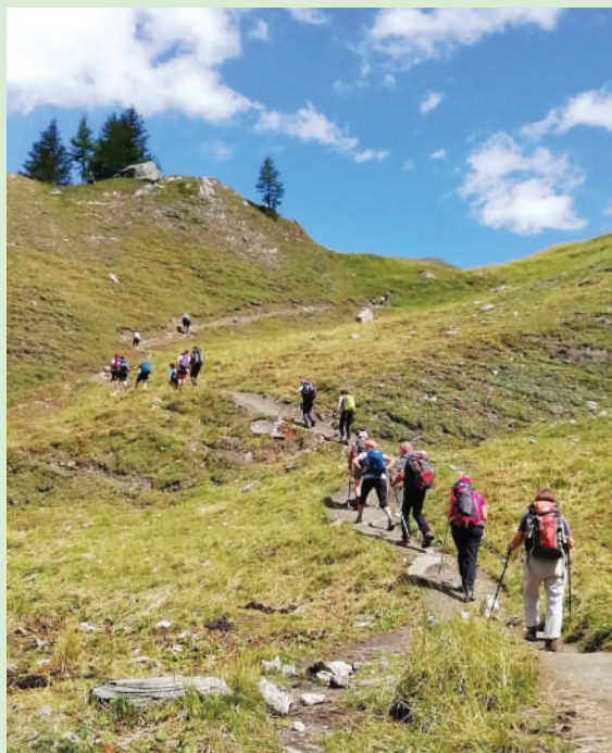
Vzpon iz doline Val Ferret proti prelazu GRAND COL FERRET (2537m) - trekking Mont Blanc