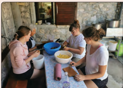
Delovno pri Krnskih jezerih