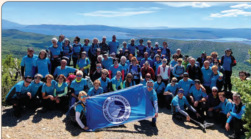
Pot kamnitih stopnic Hrvaška.