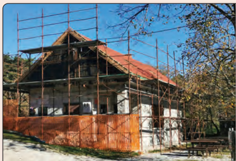
Obnova strehe in barvanje polken ter vrat na Trstelju.