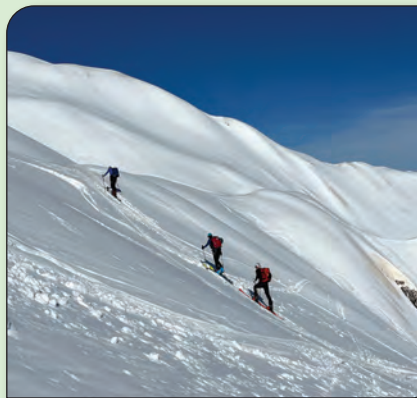
Turno smučanje.