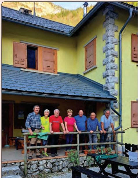
Delovna akcija v Lepeni.