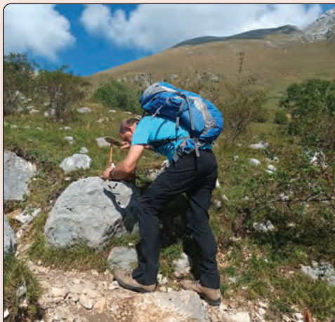
Urejanje poti planina Kuhinja – Kožljak, september 2024