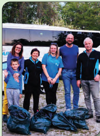
Aprilska čistilna akcija na Kekcu