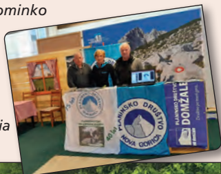
Udeležba na sejmu Alpe-Adria