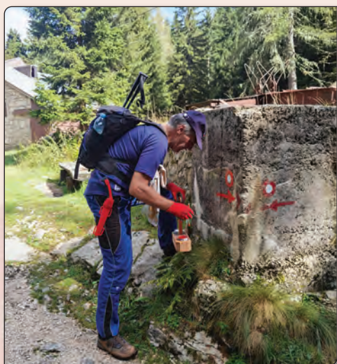
Obnavljanje markacij proti Krnskim jezerom, september 2024