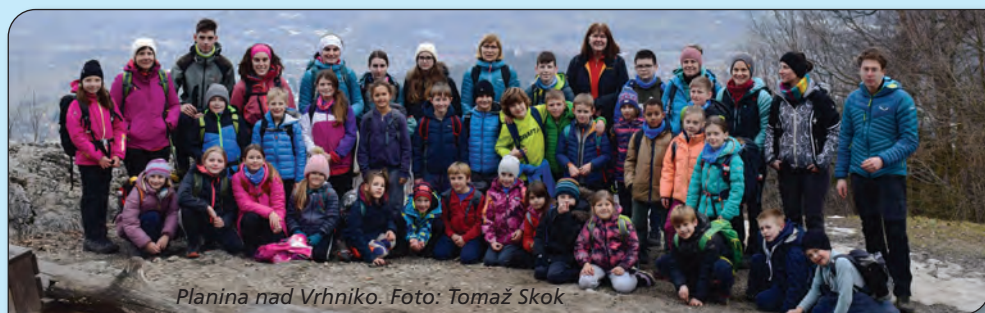
Planina nad Vrhniko.