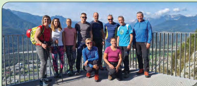
Ferata La farina del diavolo.

* datum se lahko spremeni glede na vremenske razmere