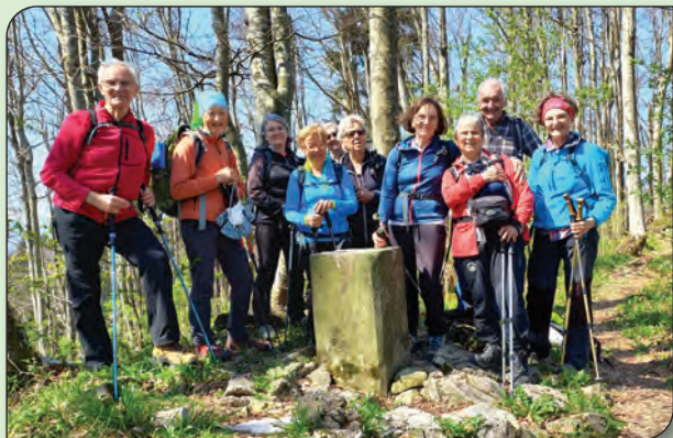
Bevkov vrh.