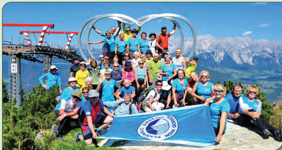
Schladming - Dachstein.