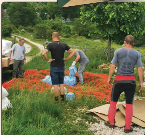
Oskrbovanje Krna.