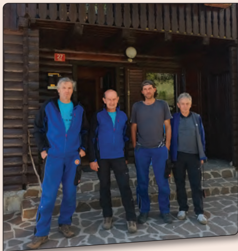
Delovna akcija Planina Kuhinja, september 2024