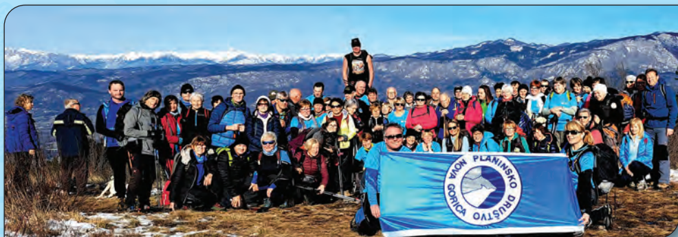
2. brezplačni izlet za člane društva na Trstelju.