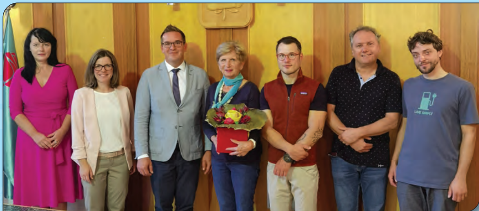
Sprejem pri županu MONG.