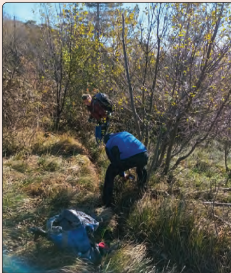
Delovna akcija Trpinovšče, november 2024