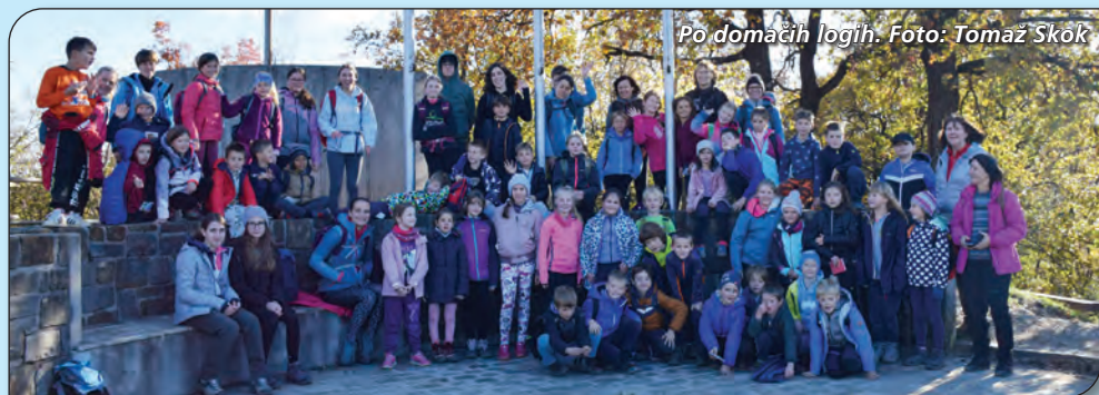
Po domačih logih.