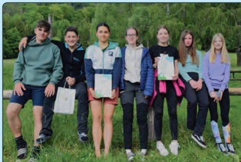
Orientacijska tekmovanja.