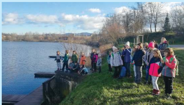
Miklavževanje v Kočevju, december 2018