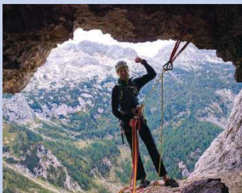
Puntarska smer v Vršacu (Zadnjica - Trenta)

Pridružite se nam lahko na sestankih vsak četrtek zvečer ob 20.30 uri, na sedežu planinskega društva.