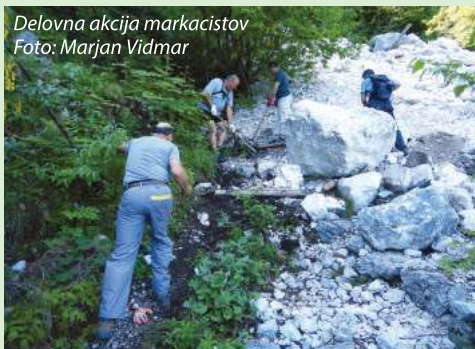
Delovna akcija markacistov