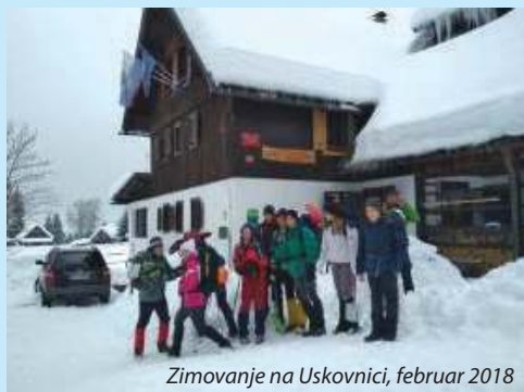
Zimovanje na Uskovnici, februar 2018