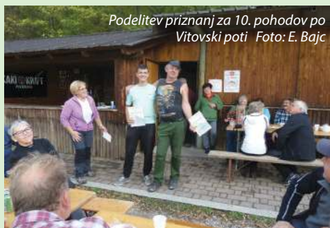
Podelitev priznanj za 10. pohodov po Vitovski poti