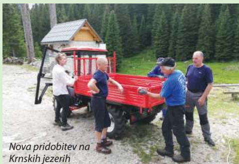
Nova pridobitev na Krnskih jezerih