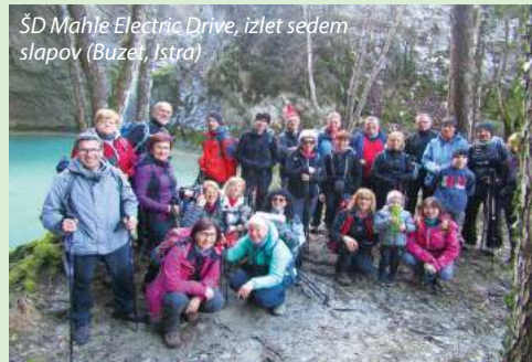
ŠD Mahle Electric Drive, izlet sedem slapov (Buzet, Istra)