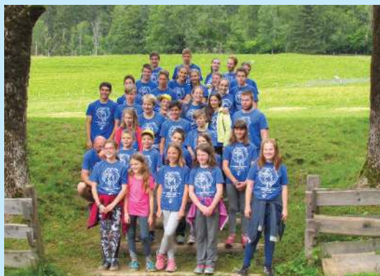
Tabor Zgornje Jezerko, julij 2018