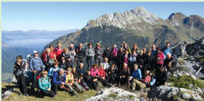
ŠD Mahle Electric Drive, Avstrija 2018 (Karnijske Alpe)