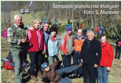
Šempaski planinci na Mali gori