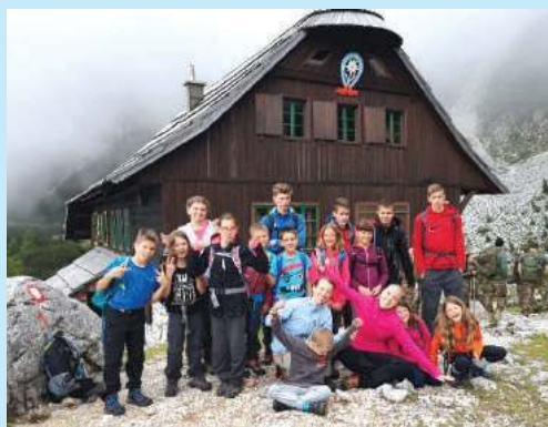
Češka koč, izlet v taboru Jezersko

(Anonimni pesnik s tabora Jezersko 2018)