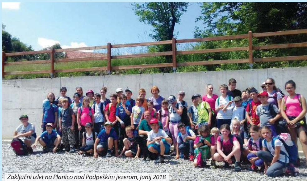
Zaključni izlet na Planico nad Podpeškim jezerom, junij 2018