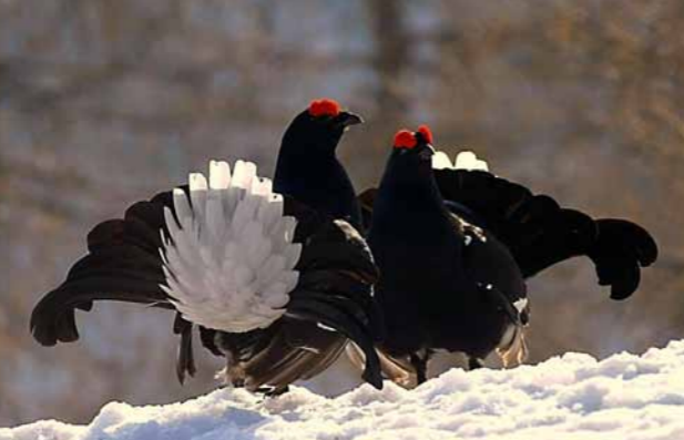
Samčka ruševca se borita za kokoši