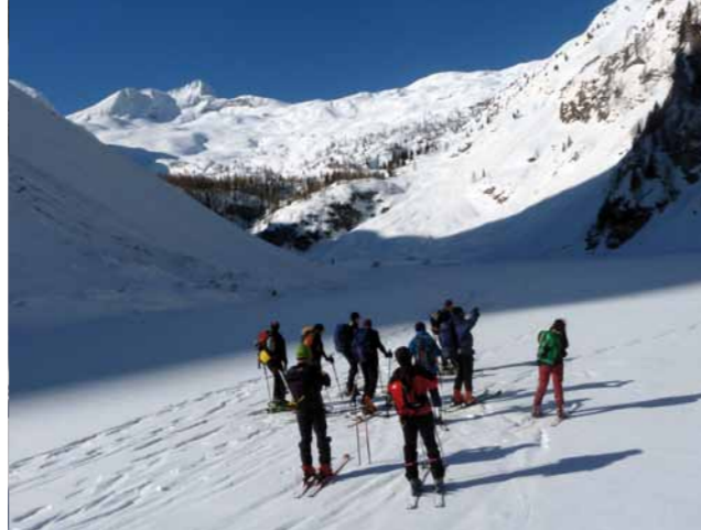
pogled z Jezera proti Krnu

Iz kočice gremo mimo planine Duplje in proti jezeru. Po njegovi levi strani nadaljujemo proti planini Polje. Krn je pred nami. Od tu dalje se držimo levo in sledimo veliki dolini, na naši desni vrh Krna in kasneje desno vidimo severno pobočje mizaste gore Batognica. Pred nami sedlo Prag. Od tu levo gor na Vrh nad Peski ali desno na Batognico. Lahko pa odsmučamo naravnost dol proti jezeru v Lužnici. Povratek v smeri dostopa.