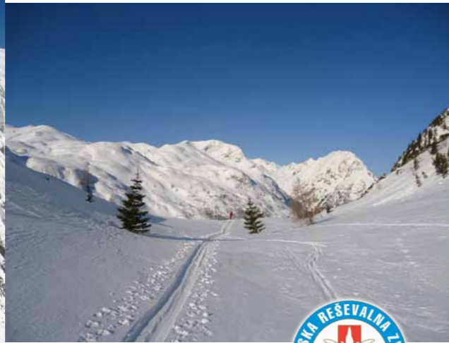
pogled s planote Za Lepočam proti dolini Krnskih jezer

KOČA PRI KRNSKIH JEZERIH TURNI SMUKI IN IZLETI