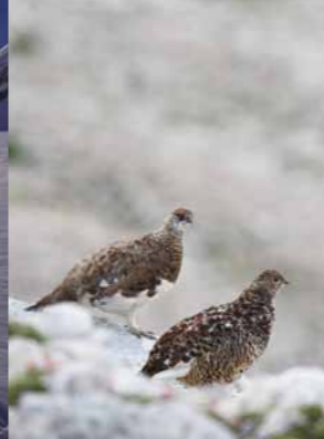
Belke so najbolj občutljive v obdobju parjenja.