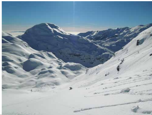
pogled z Velike Babe proti Veliki Monturi

V primeru nesreče poskrbite za tovariško pomoč in čimprej obvestite RECO na 112 (GRZS – Gorska Reševalna Zveza Slovenije).