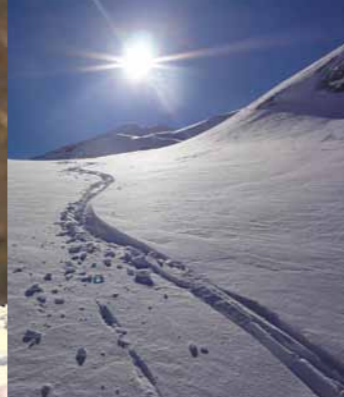
Zimsko obiskovanje gora naj bo spoštljivo do njihovih prebivalcev.

Da pozimi živali ne vznemirjamo, hodimo in smučamo tiho po ustaljenih planinskih poteh. Izogibamo se gozdnim robovom in nezasneženim površinam ter območje svojega gibanja čim bolj omejimo. V primeru, da v bližini opazimo žival, se počasi in mirno odmaknemo. Pse imejmo vedno na povodcu.