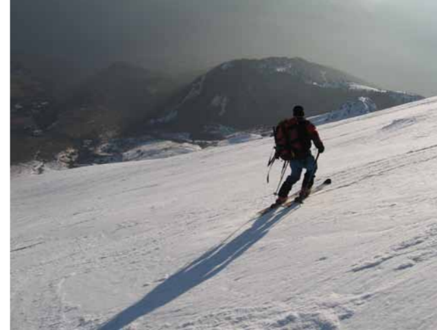
smučanje po Krnski plošči Spust s Krna v Kuhinjo

S planine Kuhinja sledimo poti na planino Kašina in do planine Leskovica, nato strmo gor po široki kotanji med Malim in Velikim Stadorjem na desni in Maselnikom na levi. Na koncu zatrepa trčimo ob steno Rdečega roba, zavijemo pravokotno levo in sledimo ob desnem pobočju Rdečega roba do prevala, kjer se nam odpre dolina Lužnica. Spodaj levo je jezero prekrito s snegom, naprej po desnem pobočju (pozor na razmere – plaz), nato po dnu doline in navzgor proti sedlu Prag (med Batognico in Vrhom nad Peski). Sledi spust po dolini proti planini Polje in Krnskemu jezeru. (opis št.1)