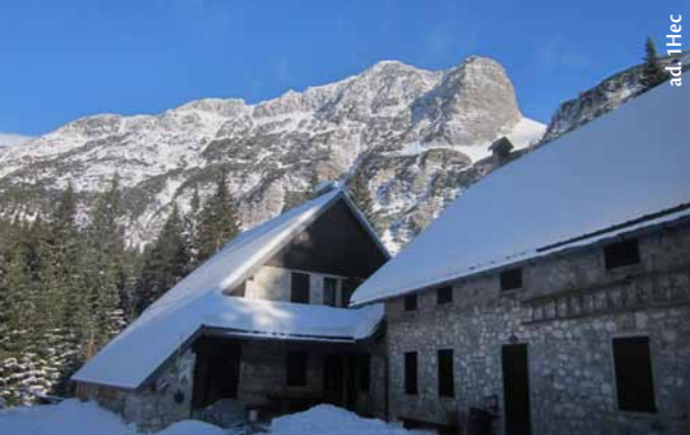
v ozadju koč Velika Baba (2013 m)